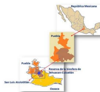
Figura 1 Ubicación geográfica de San Luis Atolotitlán

Nota. Aquí se muestra la ubicación de la zona referida.