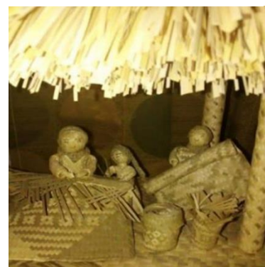
Figura 17 Figura especial de nacimiento

Nota. Imagen autoría de Arguelles, 2018.