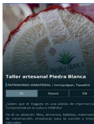
Imagen de Piedra Blanca App

Nota. Fotografía tomada desde la aplicación rutas culturales, 2019.