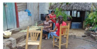
Figura 8 Tejiendo generaciones madre e hija

Nota. Imagen autoría de Castañeda, 2017.