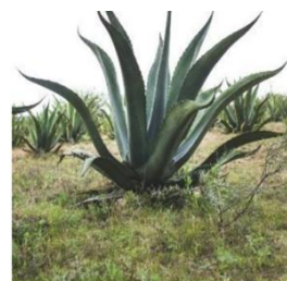
Figura 11 Maguey